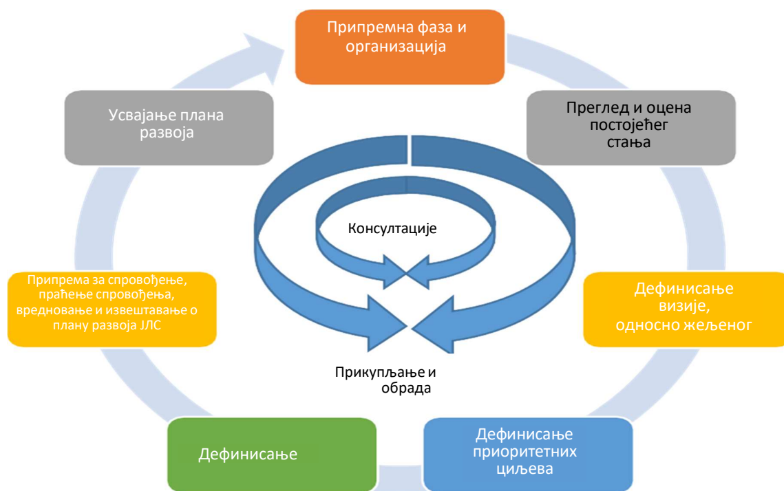
Слика 1. Фазе израде Плана развоја општине Ивањица

Прва фаза израде Плана развоја подразумевала је организацију целокупног процеса израде документа, укључујући успостављање правног оквира на локалном нивоу. У овој фази, Скупштина општине донела је Одлуку о приступању изради Плана развоја на седници одржаној 14. јуна 2022. године. Решењем председника општине именован је Координациони тим за израду Плана развоја општине Ивањица састављен од представника локалне администрације.