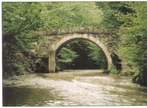
Most na Moravici u Kumanci Iz doba Nemanjica, a zove se Rimski