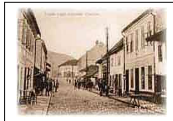
Стара чаршија у Ивањици

Радничка школа, радничка библиотека и читаоница основане су у Ивањици још 1903. године, а четвороразредна гимназија 1923. године. Убрзо након тога је основан и Фонд за сиромашне ученике, који је, поред новчаних помоћи, пружао и помоћ у одевању ученика и набавци школских уџбеника. Прво забавиште у Ивањици основано је 1935. године.