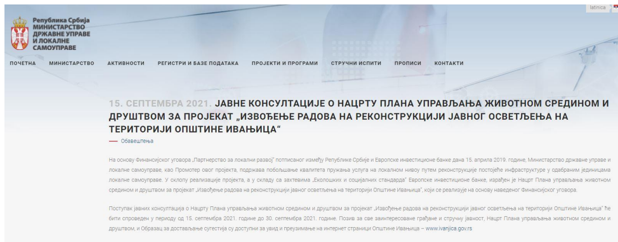
Slika: web sajt MDULS